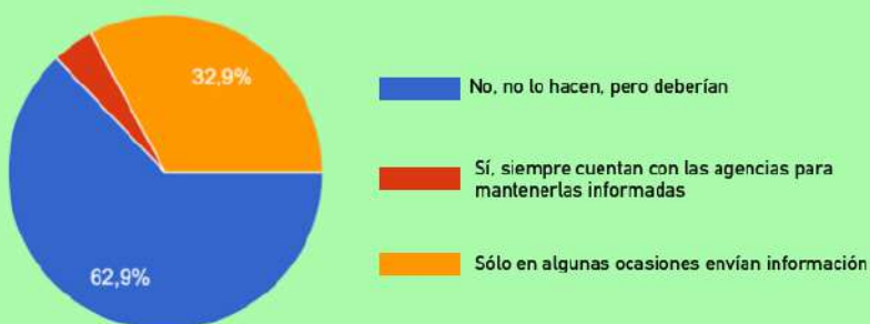
■ MONITOR DE AGENCIAS DE LOS DESTINOS SOSTENIBLES DE ESPAÑA DESTINOS & AGENCIAS DE VIAJES: INFORMACIÓN SOBRE SUS POLÍTICAS DE SOSTENIBILIDAD

El MADS cuenta con el patrocinio de la Comunidad de Madrid e Iberia y la dirección técnica de ReiniziaT y Task ONE.