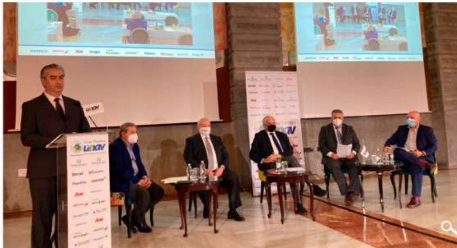
Representantes de las organizaciones empresariales que participaron en el Foro UNAV.